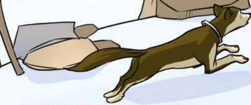
SIBERIAN DOG [sɪˈbɪriən dɔːg]